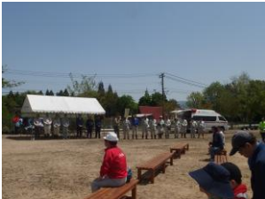
熱中症で、救急車の到着です。熱ーい！