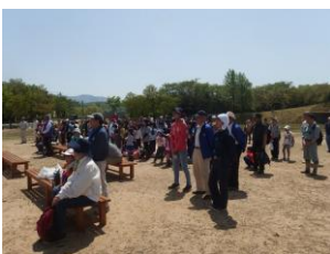
植樹の方法の説明があり、植樹会場へ移動です