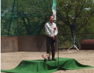
共催の北日本新聞社から