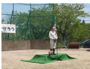
後援の田中南砺市長