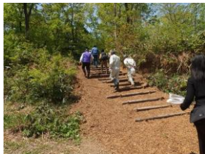
手作りの階段を上ったところに、眺めの良い会場。