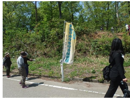
今年ものぼり旗が出迎えます。