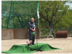
桃野実行委員長の挨拶